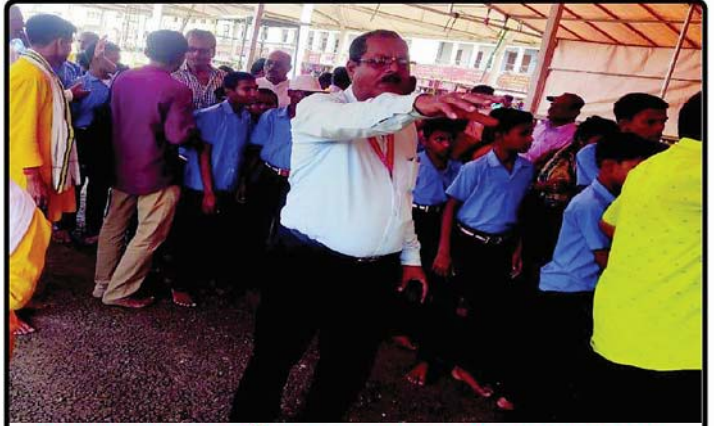
ତା ୨୪.୨୩ରେ ଦୃଷ୍ଟି ବାଧିତ ଏବଂ ବଧୂର ଛାତ୍ର-ଛାତ୍ରୀମାନଙ୍କ ଶ୍ରୀକ୍ଷେତ୍ର ଯାତ୍ରା ପରିପ୍ରେକ୍ଷାରେ ଶ୍ରୀମନ୍ଦିର ପି.ଆର୍.ଓ. ଶ୍ରୀଯୁକ୍ତ ଜିତେନ୍ଦ୍ର ନାରାୟଣ ମହାନ୍ତିଙ୍କ ଗହଣରେ ଛାତ୍ର-ଛାତ୍ରୀମାନେ ଶ୍ରୀମନ୍ଦିରକୁ ଶ୍ରୀଚତୁର୍ଦ୍ଧାବିଗ୍ରହଙ୍କ ଦର୍ଶନ ନିମନ୍ତେ ଯାଉଅଛନ୍ତି