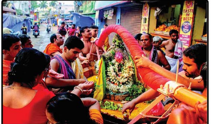
ତା ୨୦.୪.୨୩ରେ ରଢ଼ିଶୀ ଅମାବାସ୍ୟା ପରିପ୍ରେକ୍ଷାରେ ଶ୍ରୀନାରାୟଣଙ୍କ ସାଗର ବିଜେ