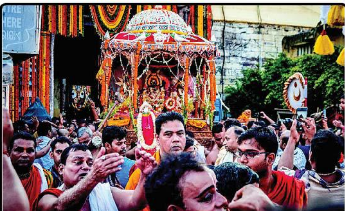
ତା ୨୩.୪.୨୩ରେ ଅକ୍ଷୟ ତୃତୀୟା ଅବସରରେ ବିମାନରେ ବିଜେ ହୋଇ ଶ୍ରୀମଦନମୋହନ, ଶ୍ରୀଦେବୀ ଓ ଭୂଦେବୀ ଶ୍ରୀମନ୍ଦିରରୁ ବାହାରି ନରେନ୍ଦ୍ର ପୁଷ୍କରିଣୀ ଅଭିମୁଖେ ଯାତ୍ରା କରୁଅଛନ୍ତି