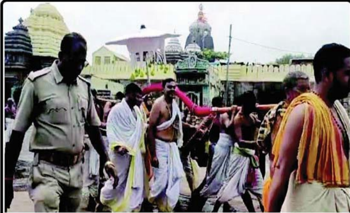
ତା ୨୯.୩.୨୩ରେ ଅଶୋକାଅଷ୍ଟମୀରେ ଶ୍ରୀମନ୍ଦିରରୁ ଶ୍ରୀଲୋକନାଥ ମହାପ୍ରଭୁ ନୀତି ସମ୍ପନ୍ନ ପାଇଁ ଜଗନ୍ନାଥ ବଲ୍ଲଭ ମଠକୁ ବିଜେ କରୁଅଛନ୍ତି