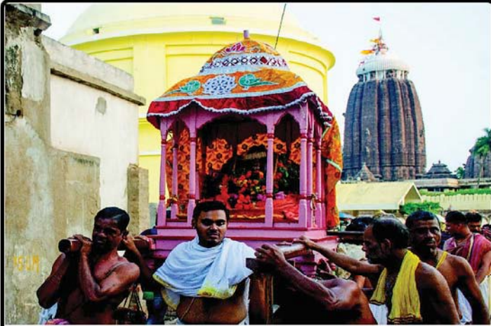
ତା ୨୫.୩.୨୩ରେ ଶ୍ରୀବାଡ଼ି ନୃସିଂହଙ୍କ ଝରି ଆଶ୍ରମ ବିଜେ